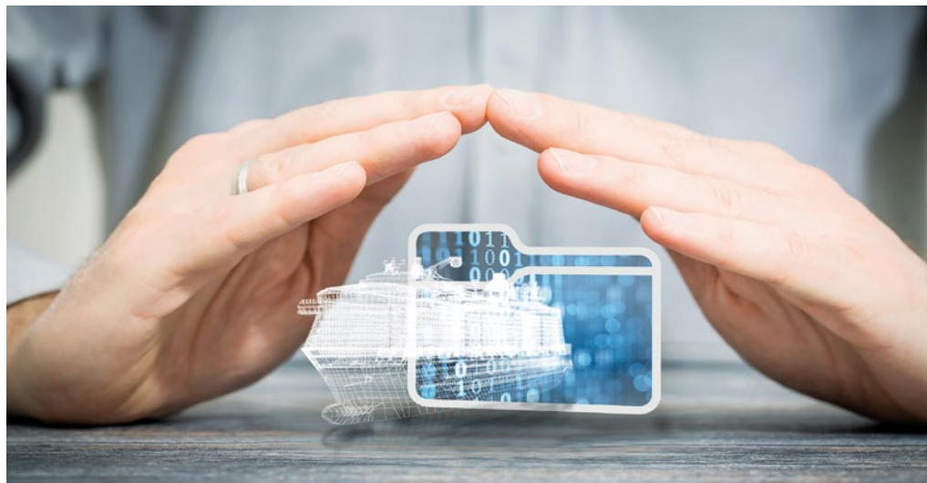
Wenn Klassifikationsgesellschaften und Betreiber digitale Schiffsdaten zur Verfügung gestellt werden, müssen das Know-how und das geistige Eigentum der Werften geschützt werden.

Mechanische CAD-Daten aus CATIA V4, V5, V6 oder Siemens NX können so aufbereitet werden, dass sie in intent-driven Systemen wie AVEVA Marine oder CADMATIC referenziert und/oder nativ editiert werden können. Die von PROSTEP entwickelten Konverter erkennen die in den Geometrie-Modellen steckenden Feature-Informationen und stellen das Modell in beliebigen CAD-Systemen als native Geometrie bereit. Die Lösung unterstützt sowohl die vollständig parametrische, als auch eine rein geometrische Konvertierung mit der Möglichkeit, die unterschiedliche Güte der Ergebnisse visuell kenntlich zu machen. Statt Geometrie zu konvertieren, kann man aber auch nur die Informationen der Bauteil-Kataloge in Quell- und Zielsystem aufeinander referenzieren und die Geometrie im Zielsystem neu erzeugen.