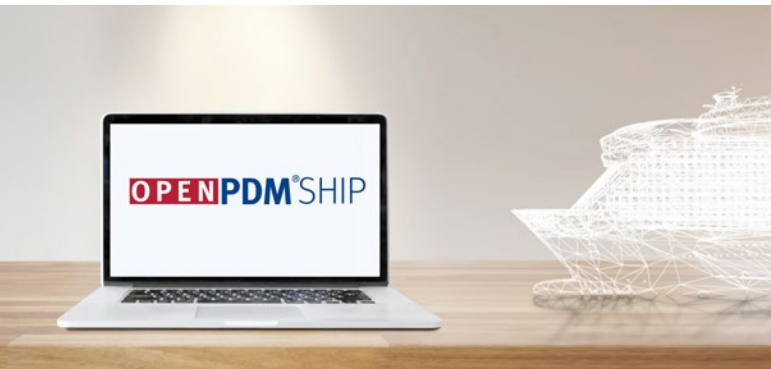
Auf Basis der OpenPDM-Technologie hat PROSTEP mit OpenPDM SHIP eine Standard-Lösung für die durchgängige Digitalisierung von Informationsflüssen im Schiffbau entwickelt.

lung digitaler Schiffsdaten, um sie weiter verarbeiten und mit ihren Informationen anreichern zu können. Dabei muss natürlich sichergestellt sein, dass das geistige Eigentum der Werften nicht gefährdet wird. PROSTEP verfügt über das Know-how und die Technologie, um nur die Informationen zu übertragen, die der Betreiber tatsächlich benötigt, und sie durch entsprechende Sicherheitsmechanismen zu schützen.